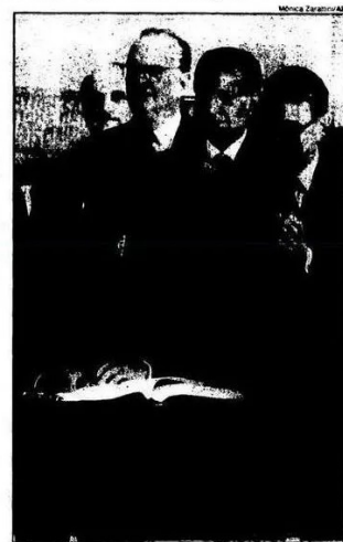
Acordo oficial Presidente Fernando Collor: discurso de abertura da cerimônia revelou complexidade das negociações

O ministro do Meio Ambiente da Itália, Giorgio Ruffolo, apoiou os ambientalistas e mantém sua proposta de taxar as emissões de gás carbônico em US$ 3 por barril de petróleo. O imposto seria pago pelos países industrializados. Segundo Ruffolo, os governos arrecadariam US$ 70 bilhões por ano com o novo imposto. O dinheiro seria dividido entre os países da Comunidade Europeia para investimentos em projetos de preservação ambiental e para transferência de tecnologia aos países em desenvolvimento.