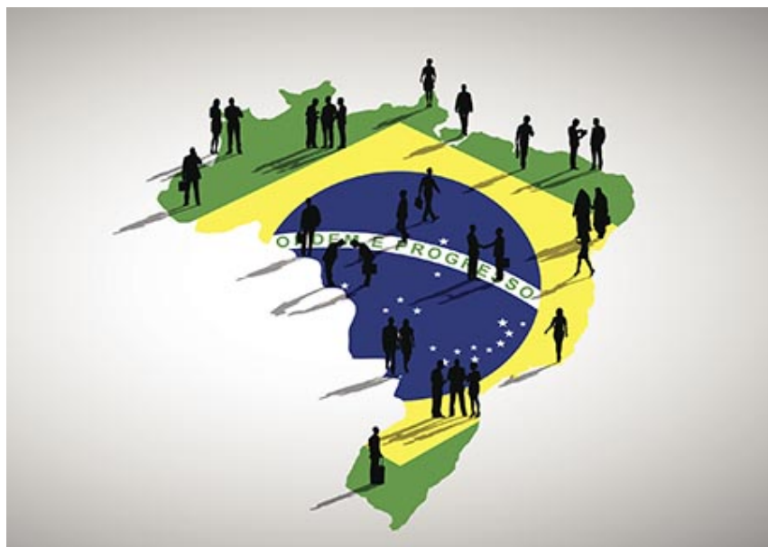
População do Brasil: 157 milhões